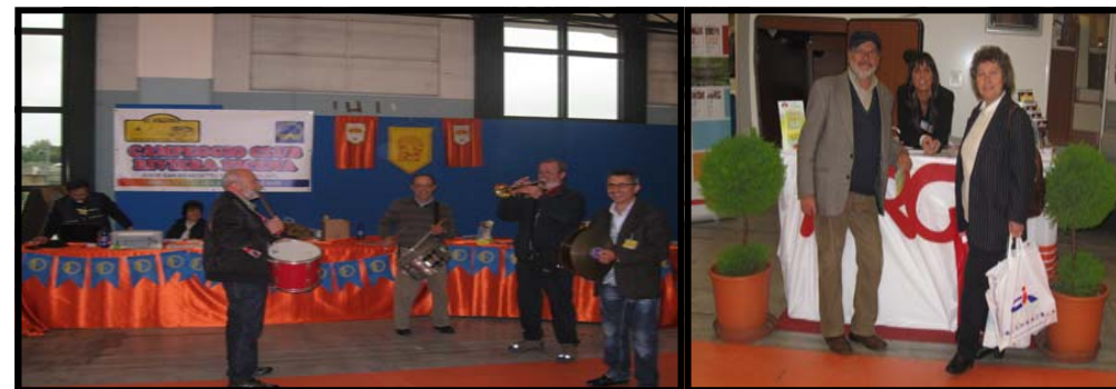
LE FOTO DEI RADUNI SONO SUL SITO